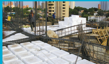
Bloques para Nervios Vaciados en sitio (losa nervada en 2 sentidos).