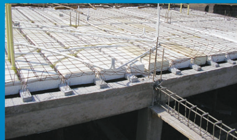
Bloques para Nervios Prefabricados.