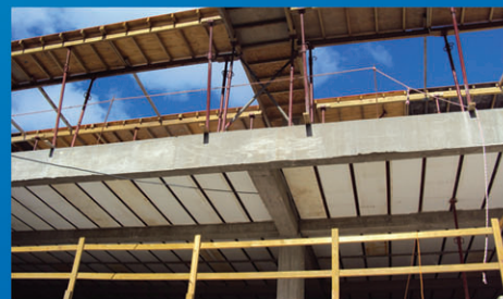
Bloques para Perfil Eco T-100.