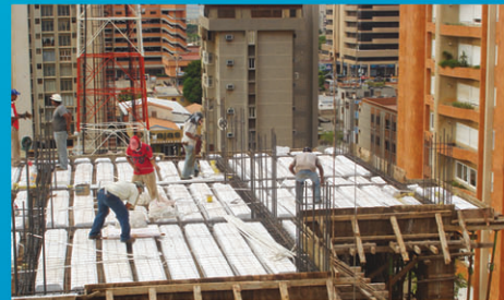
Bloques para Nervios Vaciados en sitio (losa nervada en 1 sentido).